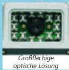
Großflächige optische Lösung