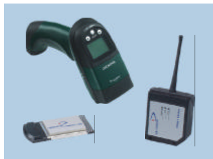
Dragon/DL Cordless Card/STAR★Modem™